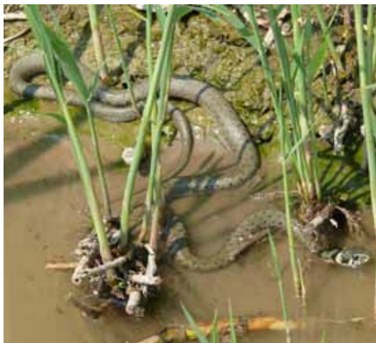
Užovka obojková ve struze při budování čistírny odpadních vod.