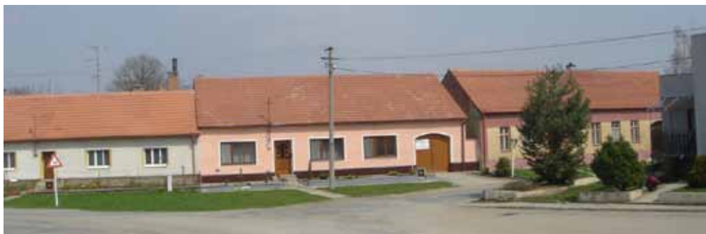
Snímek z roku 2005.