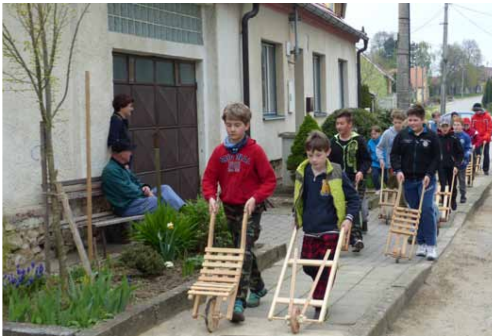
K velikonočním svátkům patří obchůzka děvčat se Smrtolkou 2. dubna a hrkání místních hochů z pátku 14. dubna 2017.