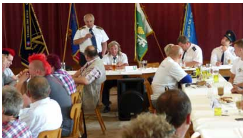
Fotografie z 15. setkání hasičů z obcí Petrovice ve dnech 17. - 18. června 2017.