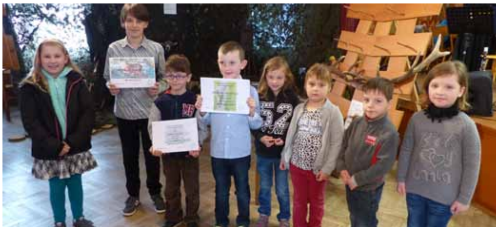
Výstava loveckých trofejí a jarní svod psů se konaly ve dnech 21. - 23. dubna 2017.