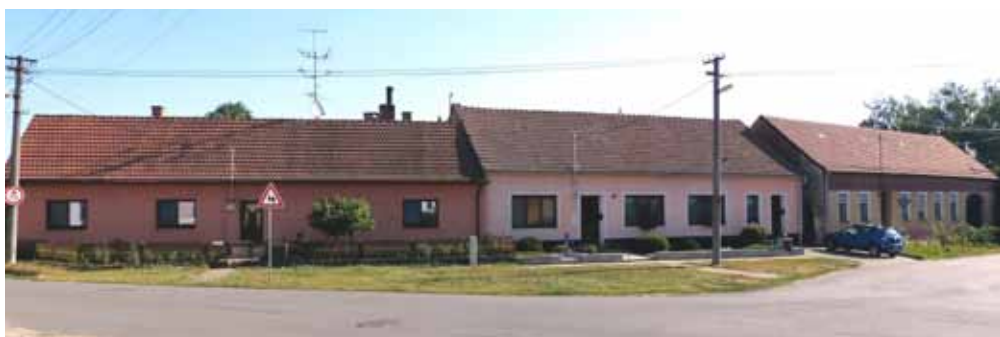
Snímek z roku 2017.