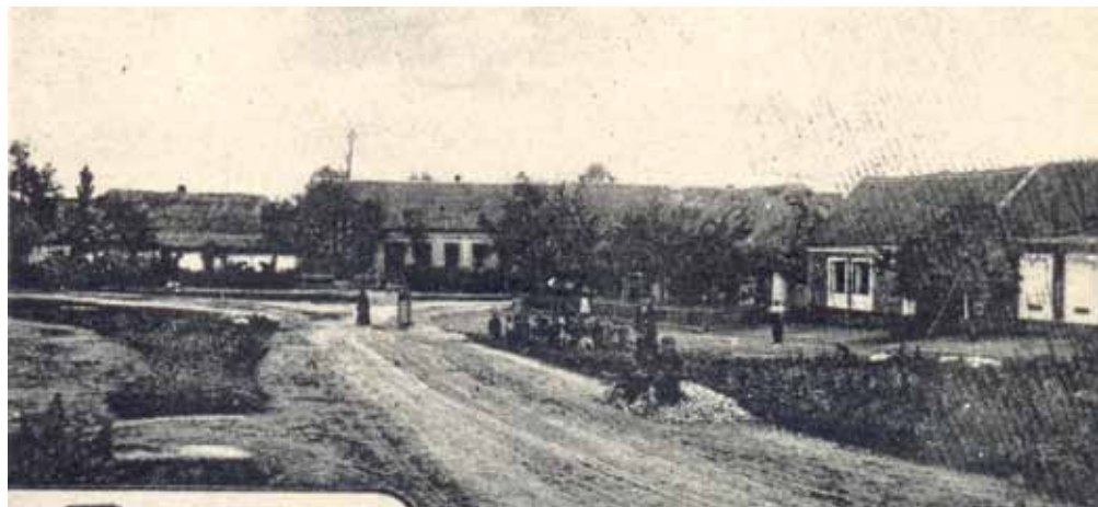
Pohlednice z r. 1919 (výřez).