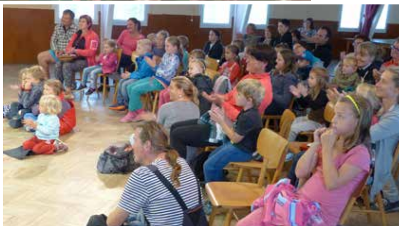
V rámci Malého festivalu loutky se v Petrovicích hrála pohádka O zlé koze v podání Divadla Matěje Kopeckého z Prahy.