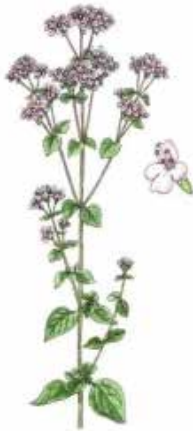
DOBROMYSL ( oregano )

Dobromysl - antiseptikum, žene žluč, proti průjmům, obsahuje provitamin A, Ce.