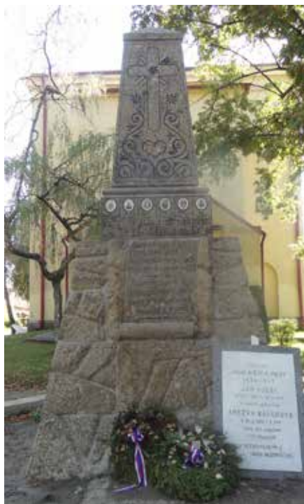
Na obrázcích je pomník z výřezu pohlednice z roku 1926 a současný stav po opravě z roku 2018.