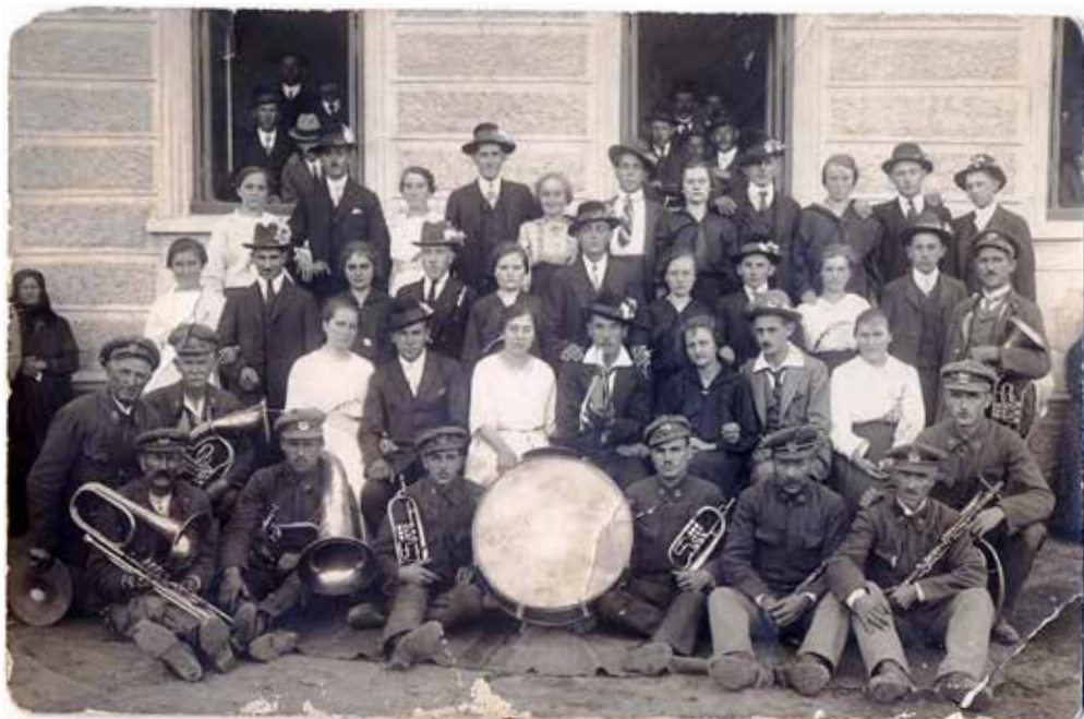
Petrovická chasa o hodech 1923.