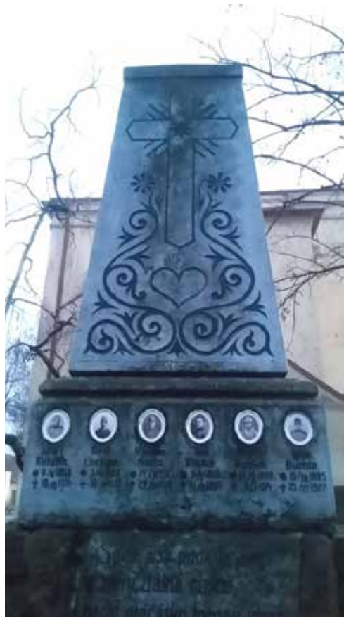
Pomník před opravou