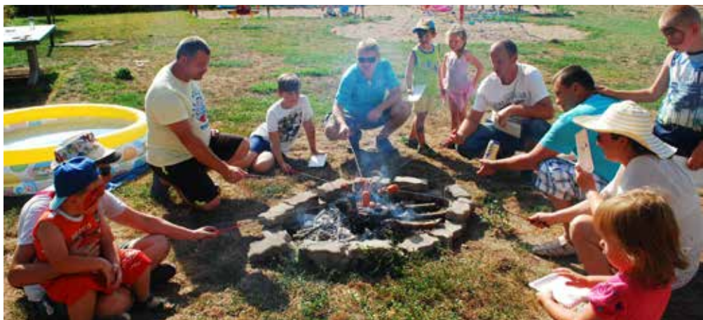
V sobotu 18. srpna 2018 se konal 10. ročník Simpsnova zrychleného přesunu.