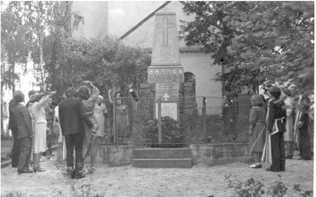
Pomník 1980 - uctění památky o hodech