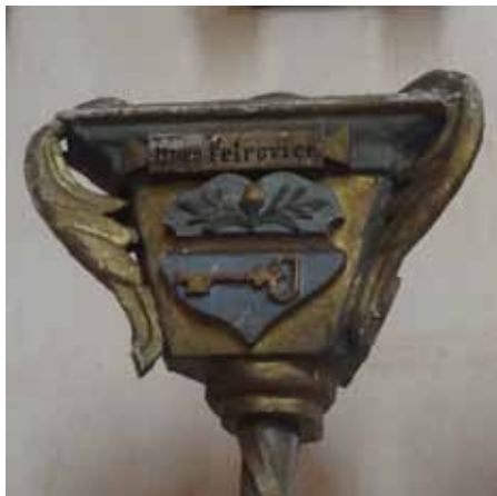
Postavník se starým znakem

Ačkoliv první písemná zmínka o Petrovicích pochází ze 13. století, nejstarší dochovaná pečeť je až z doby vlády Marie Terezie. V průběhu příprav tereziánského katastru museli rychtář, starší a přísední všech obcí monarchie podpisy a obecní pečeti stvrdit pravdivost údajů o polnostech. A právě odtud pochází nejstarší petrovická pečeť (přesněji z roku 1749). Na pečetě je nápis „INS. PETROWITZE. V. KRUMLOVA“, v horní části je žalud s dvěma dubovými listy a v dolní Svatopetrský klíč. V současné době by se její originální otisk měl nacházet v rektifikačních aktech ve fondu D 2 č. 134 a její odlitek ve „Sběrce typářů, razítek, odlitků a ústřížků s pečetěmi“ ve fondu G