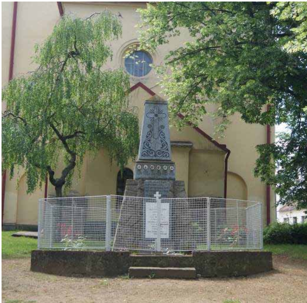
Pomník obětem války umístěný na návsi za kostelem.

V upomínku svým rodákům padlým a zemřelým ve světové válce nechala petrovická omladina v roce 1921 zbudovat pomník.