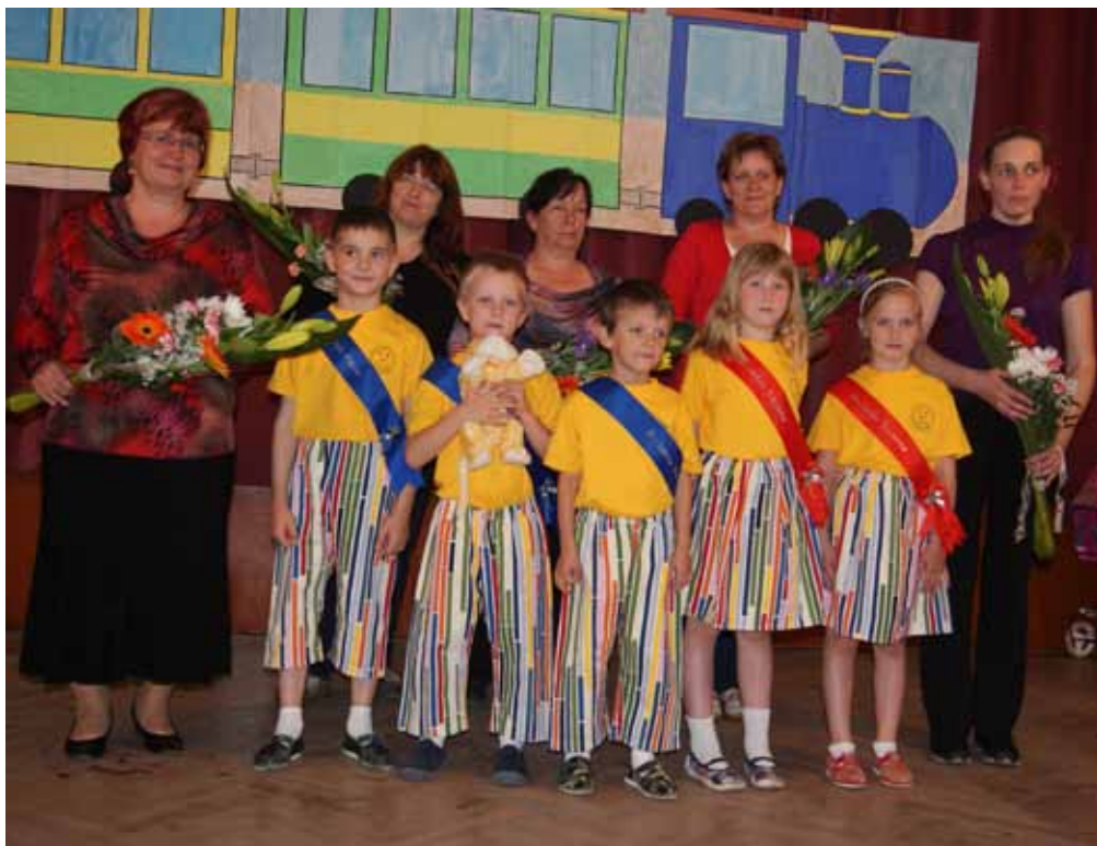
Pasování budoucích prvňáčků dne 3. června 2014.