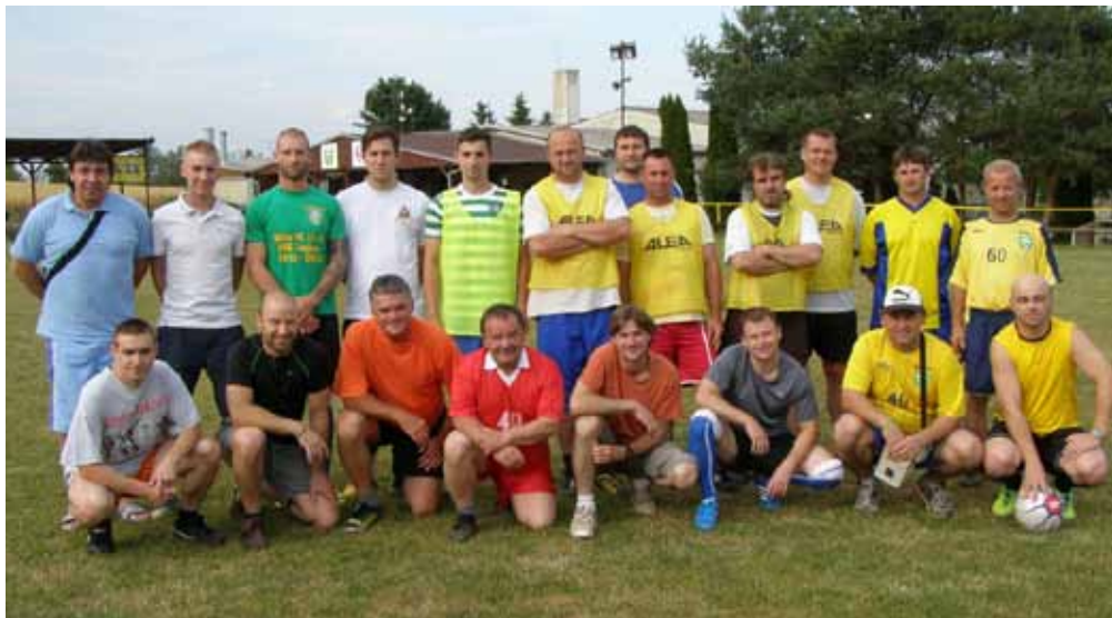
Společné foto z ukončení sezóny 2013/2014.