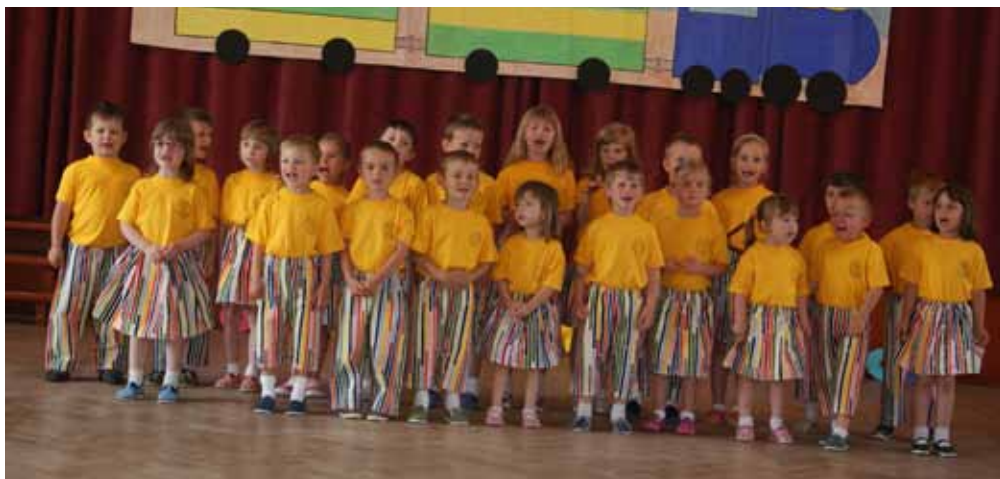
Mateřská škola - Akademie 2014 spojená se slavnostním pasováním budoucích prvňáčků dne 3. 6. 2014 v kulturním domě.