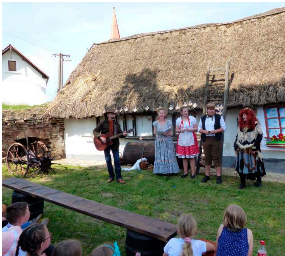
Petrovičtí ochotníci hráli 4. května dětem pohádku O dobré chaloupce.