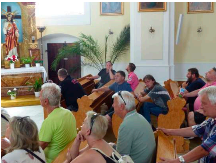
V samém závěru června se v naší obci konalo setkání hasičů z obcí Petrovic. Přípraven byl pro ně program a prohlídka obce.