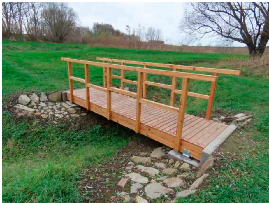
V srpnu byly na mokřadní prvky nainstalovány nové lávky a kameny byly zpevněny břehy.