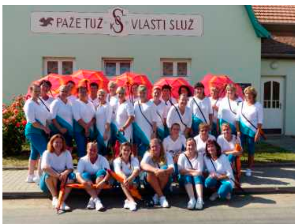
Fotografiemi připomínáme události léta - 100. výročí lesnické sokolovny a XVII. všesokolský slet, na který se také připravovali i cvičenci Lesonic a Petrovic.