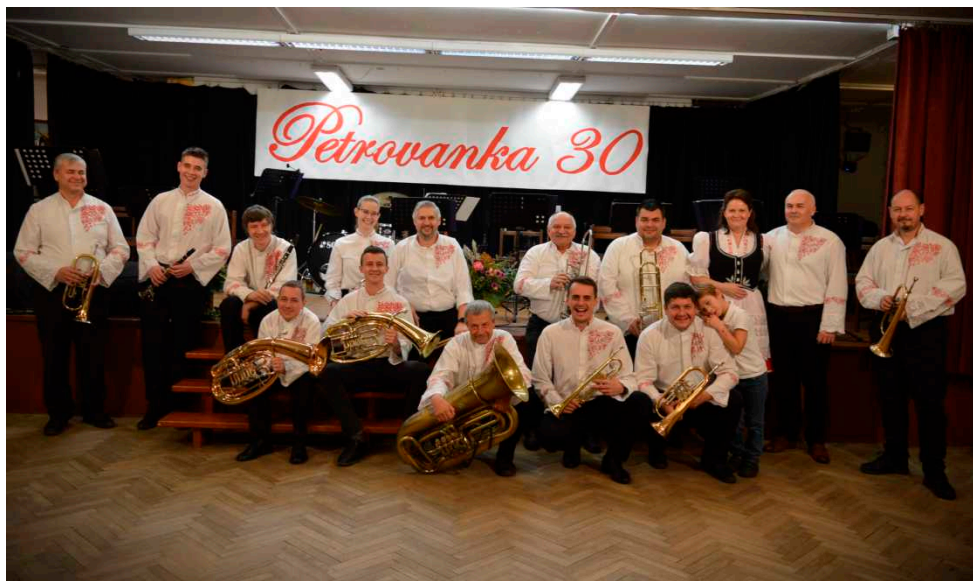
Petrovanka: 30 let tradice dechové hudby