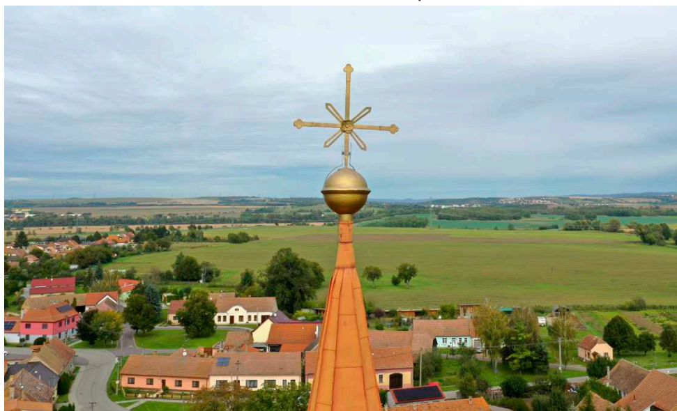
Na podzim vznikla pomocí dronu fotografie vrcholu kostelní věže.